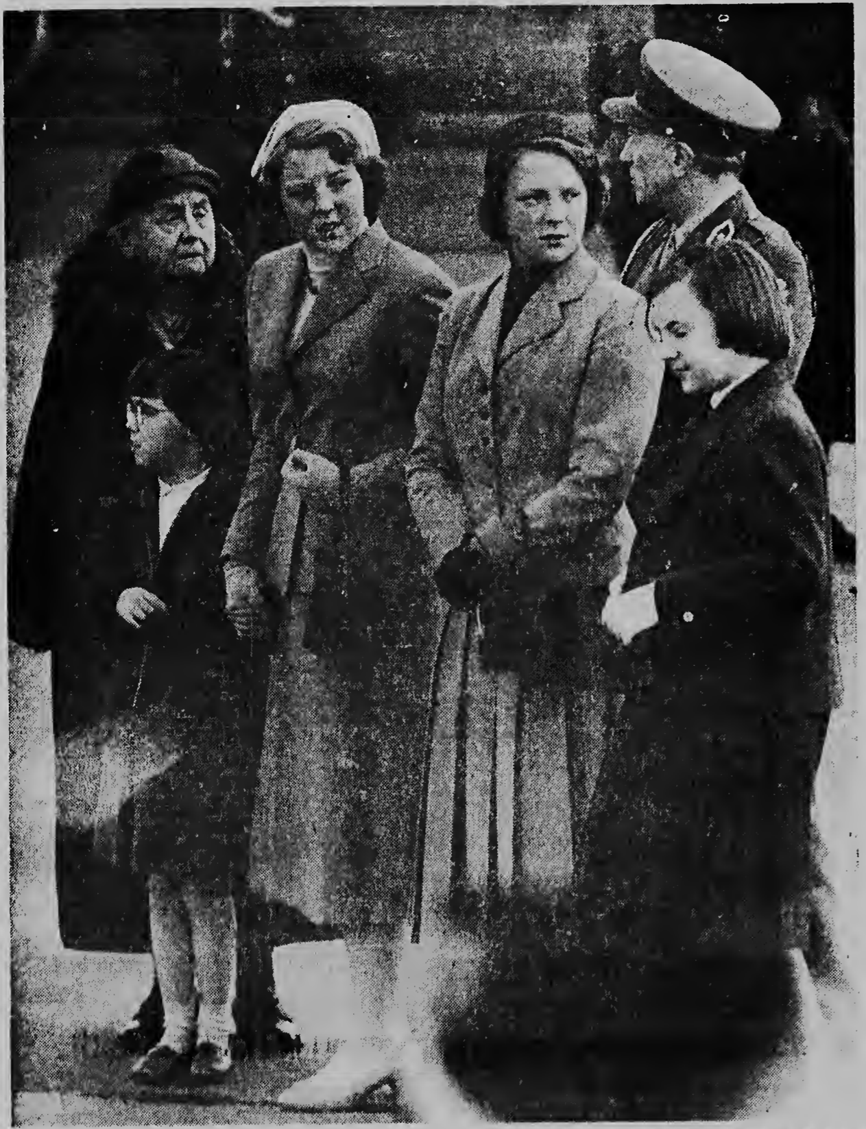
Na Schiphol un fotografo a logra di saca e portret unico aki riba un dia den verano na 1955, na unda nos por mira tur cinco Princesnan Holandes hunto. Di robes pa drechi Prinses Wilhelmina. (su dilanti) e prinsesnan Marijke, Beatrix, Irene y pa banda drechi Prinses Margriet („Piet” nan ta jamele na cas).

51 salvo di cajon ta anuncia na tur camina den pais riba 31 di januari 1938 n'e poblacion di Hulanda e nacementu di e baby aki, coe a ser duna e nomber di „Beatrix” door di su mayornan real, loke ta nifica: „esun coe un trece felicidad”. No mucho tempo despues di su nacementu Prins Bernhard a saca e promer portret di su jioe muher